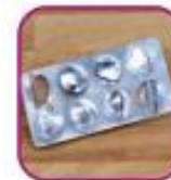
Пустые упаковки от противоаллергиче- ских препаратов