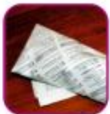
Целлофановый или газетный сверток