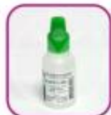
Стеклянный пузырек (из-под нафтизина и пр.)