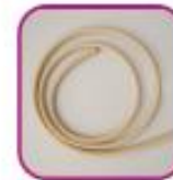
Резиновый жгут, катетер или сверну- тая в жгут ткань