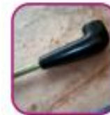
Предметы напомина- ющие курительные трубки