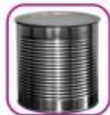
Жестяная банка с вырезанным «окошком»