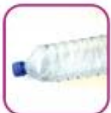
Пластиковая бутылка 0,3-0,5 литров