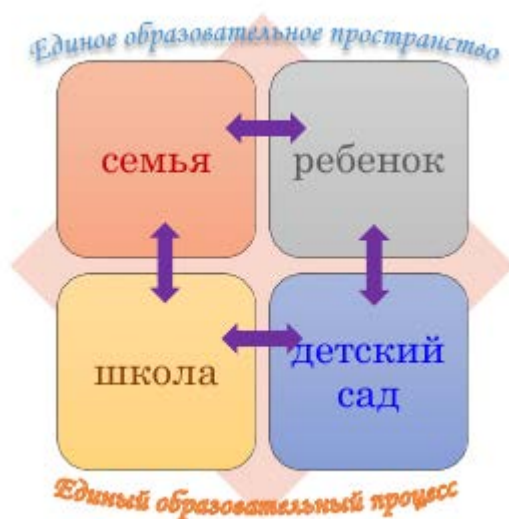
Схема № 1: Модель взаимодействия отношений партнеров образовательного процесса

Ключевая идея работы нашего образовательного учреждения в данном направлении заключается в том, что главным действующим лицом в образовании ребенка выступает родитель (законный представитель), и взаимодействие родителей, педагогов (как учителей начальных классов, так и воспитателей дошкольных групп) строится на равенстве позиций партнеров с учетом их индивидуальных возможностей и способностей.