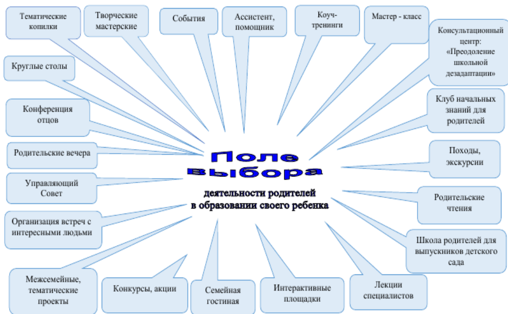
Схема № 2: «Поле выбора» деятельности родителей в образовании своего ребенка

Одной из эффективных форм взаимодействия образовательного учреждения и семьи является организация межсемейных совместных проектов «Взрослые и дети» . Семьи обучающихся объединяются в малые группы для создания совместного продукта, что способствует их сближению, установления положительных взаимоотношений между ними, при этом ребенок видит образцы взаимодействия и отношений. Например, по теме «Хлеб – всему голова» семьи объединились по национальностям и представляли совместные конечные продукты, связанные национальными традициями. Не менее интересной и увлекательной формой взаимодействия является семейная гостиная , в которой принимают участие семьи воспитанников и учащихся. В гостиные семьи представляют свои проекты, участвуют в конкурсах разной направленности, что дает возможность обмениваться опытом семейного обучения и воспитания, сближения родителей, выявления семейных традиций, увлечений, проявления инициативы, активности и творчества. Именно возрождению семейных и национальных традиций была посвящена гостиная «Традиции моей семьи», в ходе которой, родители и дети пришли к выводу, что семейные традиции – это атмосфера дома, уклад жизни и привычки всех жителей дома. Ребенок принимает мир глазами родителей. Они для него пример. Семейные традиции необходимо соблюдать, так как они дают ребенку, во-первых – гордость за свою семью, во-вторых – незабываемые впечатления, в-третьих – стабильность в семье.